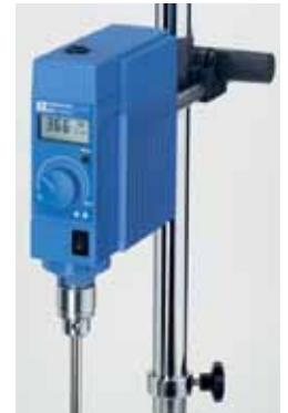
EUROSTAR power c-v 具轉速及扭力顯示